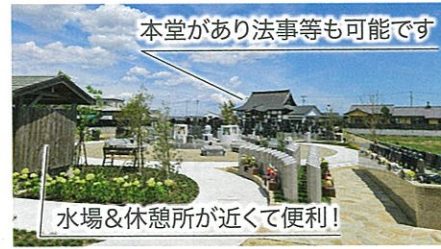
本堂があり法事等も可能です

名取樹木葬さくらは、故人様を永続的に供養したいという皆さんの思いから誕生しました。お墓参りしやすく管理が簡単で、管理費のかからない綺麗なモダンな都会型の樹木葬墓苑です。